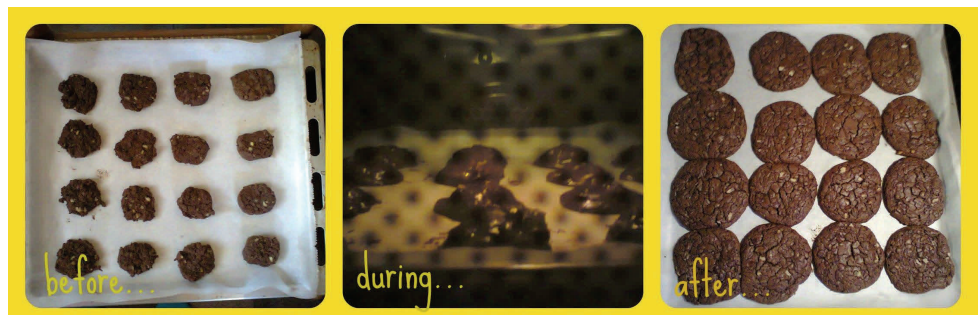
Τα Bookcookies του Σμήνους Αγριάς

Ήδη αρκετά Σμήνη από όλη την Ελλάδα έχουν ξεκινήσει την προσπάθεια... Πάμε να γεμίσουμε τη χώρα με την γαργαλιστική μυρωδιά των Bookcookies μας !!!